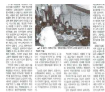
5.18 기념 공개토론회 열려

었는데, 이종 단장은 "농민 집 참여하러 생이 함께 하 습으로 느낄 겠다"라고 보 관으로 4부 토론 및 자유 대 새롭게 알 대한 자신의 를 어무었다.