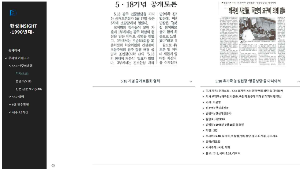
[그림 3] 한성인사이트 기사 및 콘텐츠 메타데이터