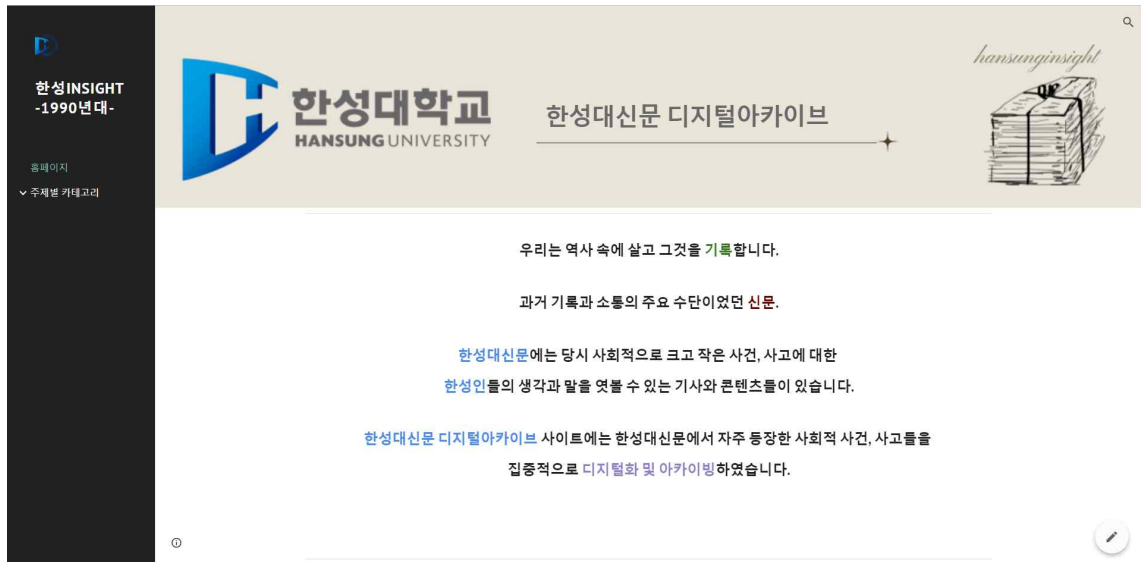
[그림 6] 한성인사이트 메인 1