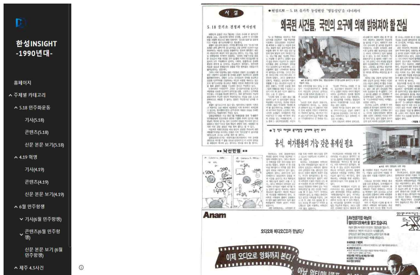
[그림 4] 한성인사이트 신문 본문 보기