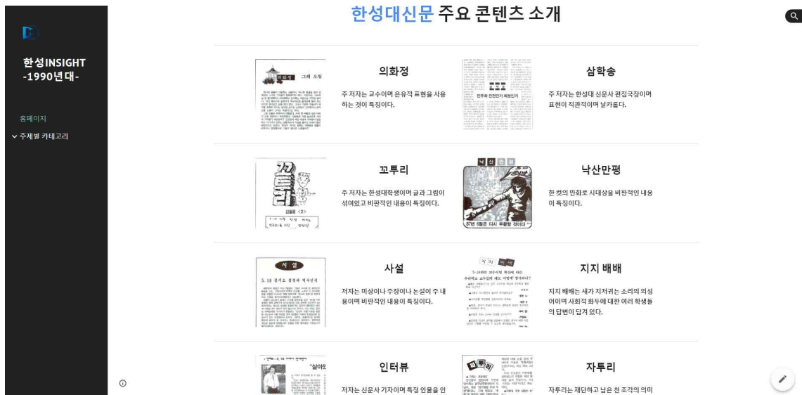
[그림 7] 한성인사이트 메인 2